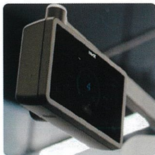
トレーニングマシンによる トレーニングデータ管理機能