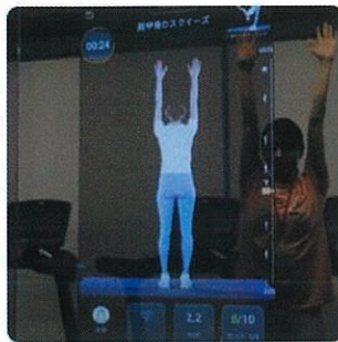
フィットネスミラーによる トレーニングパートナー機能